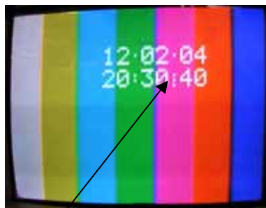
入力タイムコード読み取りエラー 表示は分と秒の間のコロン

PC Windows 95 / 98 / ME / NT / 2000 / XPに対応。