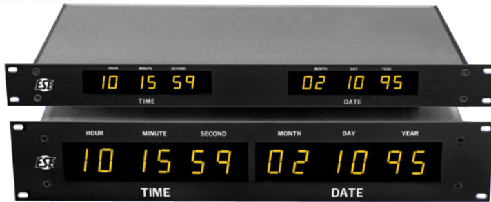
ES-127U / BLACK