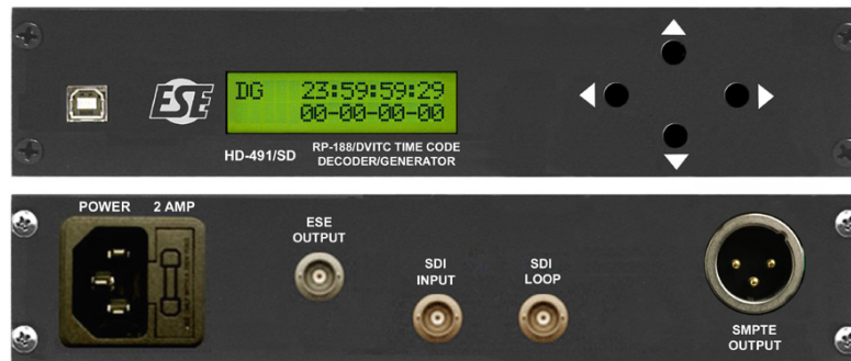
HD-491/SD / P