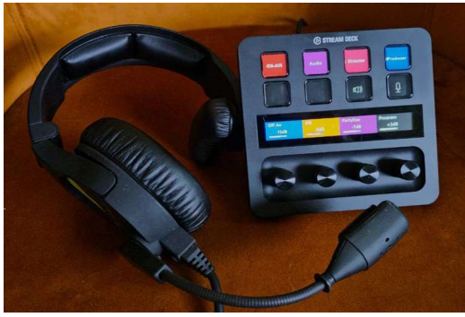
ストリームデッキでのVCP