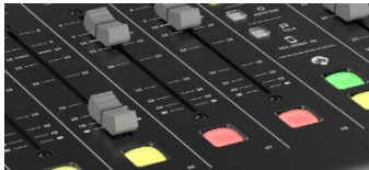
航空電子機器級のスイッチと 高品質な長寿命フェーダー