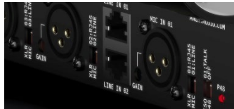
StudioHub+ RJ45 コネクター (ライン用) XLR コネクター(マイク用)